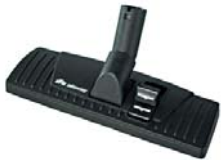
80867 Combi borstel voor vloeren Model 300 zonder wieltjes.