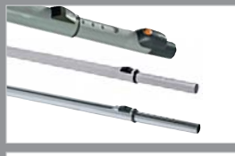
81051 Premium inschuifbare steel, aluminium 80885 Inschuifbare steel, aluminium 80886 Inschuifbare steel, staal