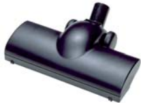
80717 Turbo borstel voor vloeren Met draaiende borstel voor tapijt en kleden.