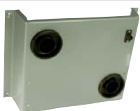
80761 Muurplaat, Opbouw montage