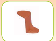
Slang ophangbeugel 81055