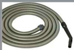
Standaard slang Zonder schakelaar op de handgreep 10 meter 81217