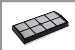
Filter 80686 HEPA filter voor DUO