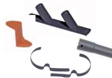
81054 Slang houder 81053 Borstelhouder 81055 Slang ophangbeugel 80917 Adapter