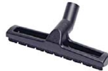
80991 Parketborstel 300 Borstel voor alle harde vloeren.