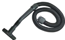
81010 Uittrekbare slang 1-4 meter Handig hulpmiddel in keuken, bijkeuken, of bij de open haard.