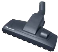
80876 Premium borstel voor vloeren Model 300 met wiel.