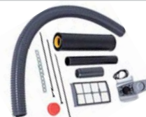
81116 DUO Aparto kit Ombouwset voor DUO. Hiermee is er geen zuigbuis en uitblaasbuis meer nodig.