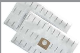
80687 Duo stofzak 10 liter, microvezel, 2 stuks