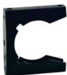
80293 Allway beugel 44 mm Voor een mooie afwerking.

Alle accessoires zijn verkrijgbaar bij de Allaway leveranciers.