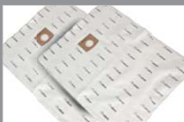
80689 Microvezel stofzak 13 liter, 2 stuks (C-serie en DV) 80688 Microvezel stofzak 20 liter, 2 stuks (A-serie)