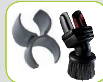
Combi mondstuk voor meubels, 80870