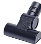
80712 Turbo borstel voor meubels Met draaiende borstel voor meubels en de auto.