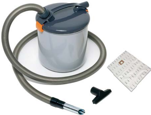
De 20 liter voorafscheider zuigt gemakkelijk as, bouwstof en water in de stofzak of emmer.

De 20 liter voorafscheider is gemaakt voor het opzuigen van bijzondere materialen en stoffen. Hij is perfect voor het opzuigen van zaagstof, bouwstof, as, grof vuil, glas en water. Het onderhoud aan de voorafscheider is eenvoudig: het speciale filter kan met water schoongespoeld worden. De stofzak die gebruikt wordt voor het zeer fijne materiaal is simpel te verwisselen.