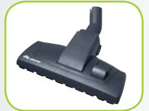
Combi borstel voor vloeren, met wiel, 80876