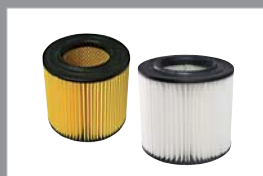
Filter 10813 A/C-serie, DV en Express 10819 Wasbaar filter A/C-serie, DV en Express