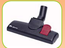
Combi borstel voor vloeren twee wieltjes, 80877