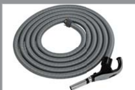
Standaard slang Met schakelaar op de handgreep 10 meter 81244