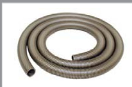
Zuigslang 10 meter 80921