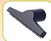
Meubel mondstuk 80981