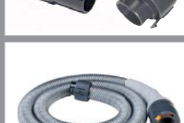
80910 Insteekplug, Classic 80918 Insteekplug, Optima