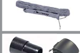
80781 Slang sok Beschermt kwetsbare oppervlakken