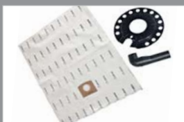
Stofzak installatie kit met een microvezel stofzak 81114 C-serie en DV, 13 liter 81115 A-serie 20 liter