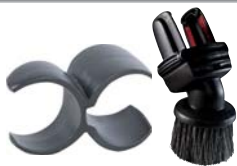
80870 Combi borstel voor meubels Op twee manieren te gebruiken voor alle meubels en materialen.