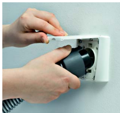
Alle Allaway zuigsets (Premium en Standaard) zijn voorzien van een Premium insteekplug. Deze is eenvoudig in het zuigcontact te klikken en blijft goed vast zitten. Het eruit trekken gaat net zo eenvoudig.

De stalen Standaard zuigsets zijn voorzien van een goede kwaliteit standaard onderdelen. Ze zijn verkrijgbaar met of zonder een schakelaar op de handgreep. U kunt de zuigsets aanvullen met diverse borstels en ophangbeugels voor het opbergen van het geheel (optie).