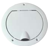
80792 Uitblaasklep Klep voor de uitblaaslucht aan de buitenzijde van de woning.