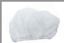
Filternetje 80692 5 stuks, A/C-serie, DV en Express. Een filternetje vermindert de noodzaak van filteronderhoud.