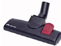
80877 Combi borstel voor vloeren Model 270 met wieltjes.