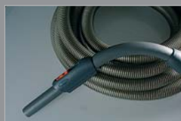
Premium slang Zonder schakelaar op de handgreep 10 meter 81209