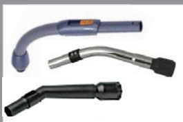
81052 Handgreep Premium 80906 Handgreep staal 80907 Handgreep kunststof