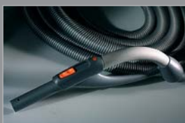
Premium slang Met schakelaar op de handgreep 10 meter 81211