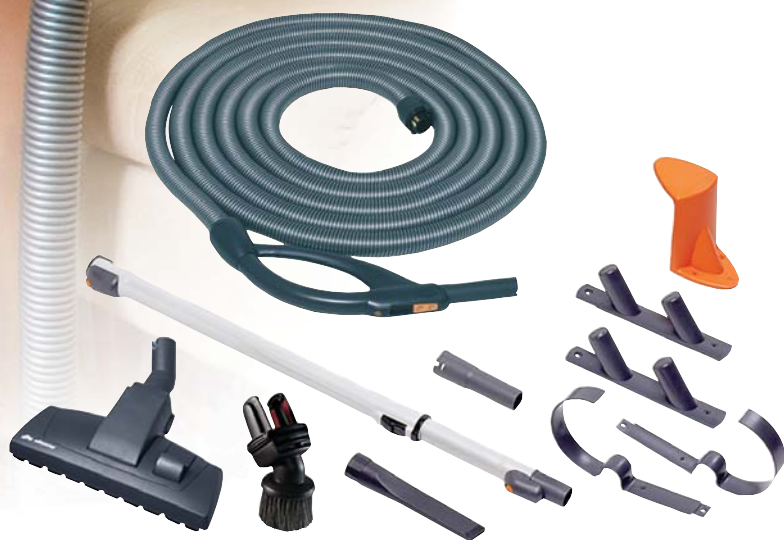
De Premium zuigset met een schakelaar op de handgreep.

Tafels, stoelen, onder een bank, radiatoren, vloerkleden, matrassen, gordijnen.... De beste manier om dit soort oppervlakken en objecten te stofzuigen is door een borstel te gebruiken die hiervoor het meest geschikt is. Alle Allaway zuigsets bevatten de hulpmiddelen die u nodig heeft voor huishoudelijk stofzuigen. Een borstelset, inschuifbare steel, slang en een slangophangbeugel zijn onderdeel van de Standaard en Premium zuigsets. Voor een beter resultaat heeft Allaway een grote keuze in borstels en diverse accessoires zoals een turboborstel voor vloeren, een uittrekbare slang van 1-4 meter en een voorafscheider waarmee u water kunt zuigen of de as van de open haard.