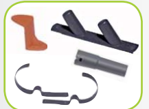
Slang houder \ borstelhouder \ slang ophangbeugel \ adapter 81054 \ 81053 \ 81055 \ 80917