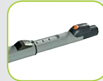
Inschuifbare steel Aluminium, 81051