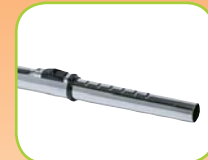
Inschuifbare steel staal, 80886