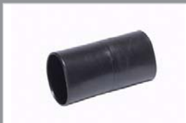
80915 Slang koppelstuk