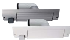
Plintzuigcontact 81234 wit 81235 zilver Door het openen van de klep start de stofzuigmotor.