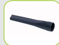
Spleet mondstuk, 80880