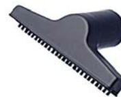
80981 Meubel mondstuk Smal handzaam borsteltje.